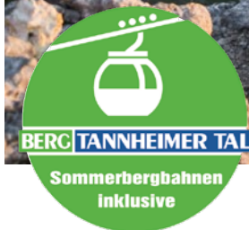
Änderungen vorbehalten.